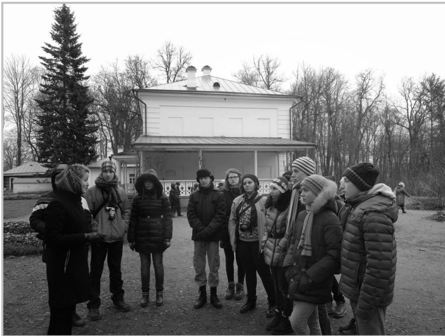
Учащиеся 8-9 классов в Ясной Поляне около дома Л.Н.Толстого

написанную на ней, не будет больше на земле войн и болезней, и все люди станут «муравейными братьями».