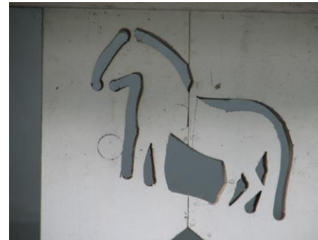
Элемент декора дома Л.Н.Толстого

написанную на ней, не будет больше на земле войн и болезней, и все люди станут «муравейными братьями».